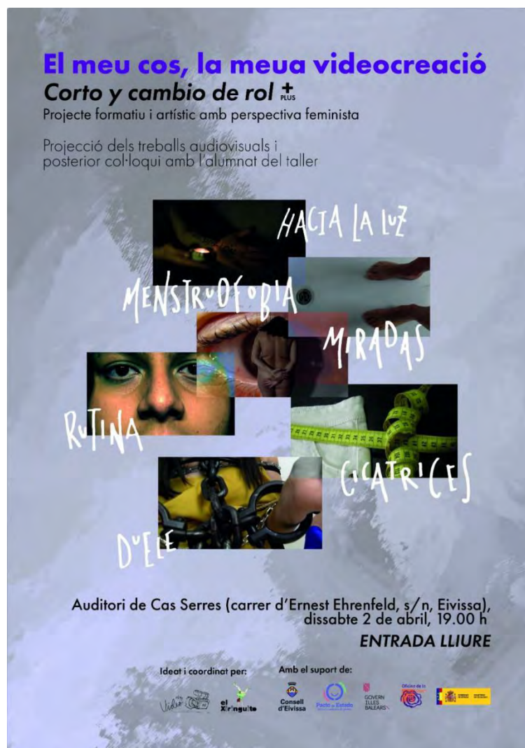
Figura 14: Cartell presentació final

importància de donar difusió al projecte i als audiovisuals per tal de fer arribar a més públic els missatges de denúncia de violències i d'apoderament feminista que estan transmetent.