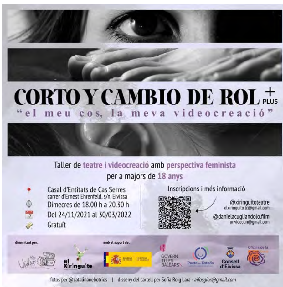
Figura 1: Cartell de difusió Corto y Cambio de Rol + plus