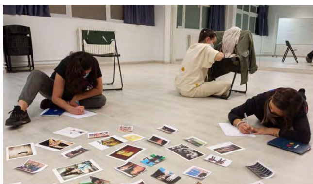
Figures 10,11,12 i 13: realització dels curtmetratges

Durant el taller les participants han realitzat 6 audiovisuals de creació individual i 2 videoarts col·lectius, on l'alumnat ha plasmat la seva visió sobre els temes tractats al llarg del taller. Les videocreacions individuals han partit de textos personals de cadascuna de les alumnes, les quals també han elaborat el seu propi guió tècnic. Durant el rodatge totes les participants han comptat amb la col·laboració de les docents del taller, així com d'altres alumnes.