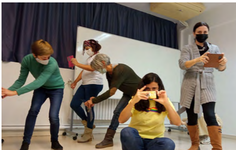
Figures 6, 7, 8 i 9: Activitats i pràctiques de cinema