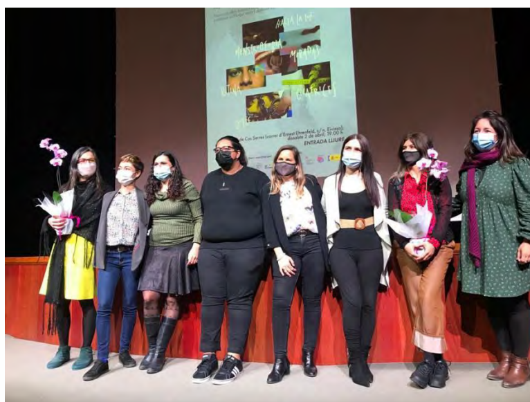
Figura 15: participants i formadores en l'acte de presentació final