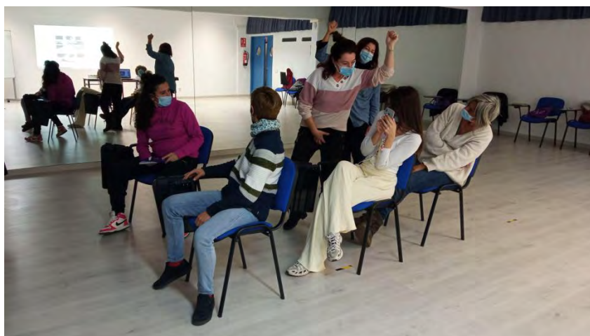
Figures 2,3,4 i 5 : Activitats de teatre